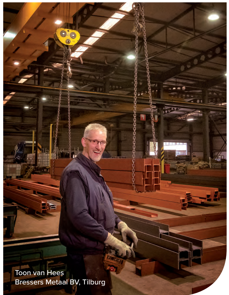
Toon van Hees Bressers Metaal BV, Tilburg

WTG onderhandelt namens haar leden met de werknemersorganisaties in de Technische Groothandel over nieuwe CAO's, te weten de arbeidsvoorwaarden-CAO en de CAO voor het FKB (Fonds Kollektieve Belangen). Met deze CAO's, die altijd algemeen verbindend worden verklaard, zorgt WTG in de gehele Technische Groothandel voor een uniform sociaal beleid en gelijke concurrentievoorwaarden. Als lid van WTG hebt u directe invloed op de CAO-onderhandelingen. Dit doordat u via de ledenbijeenkomsten, telefoon en e-mail uw mening en wensen kunt uiten. Deze kunt u zo delen met het bestuur en de leden. Bovendien bepaalt de Algemene ledenvergadering van WTG of een door het WTG-bestuur afgesloten CAO-akkoord wordt goedgekeurd of niet. Niet leden missen deze inspraak, terwijl zij zich toch aan de overeengekomen CAO's moeten houden.